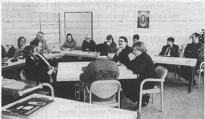
Rollenspiel: Fünf Prüflinge simulieren eine Sitzung, die anderen schauen zu und analysieren anschliessend ihre Beobachtungen.

Zwei der Rollenspiele nahmen dabei einen völlig gegensätzlichen Verlauf. Im ersten versuchte der «Schulpräsident» mit ruhiger, sachlicher Art sämtliche Emotionen auszuschalten, dennoch kamen sie später in Form von persönlichen Angriffen der frustrierten Lehrvertreter hoch. Im zweiten Spiel hingegen beruhigten sich die Ak-