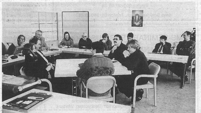
Rollenspiel: Fünf Prüflinge simulieren eine Sitzung, die anderen schauen zu und analysieren anschliessend ihre Beobachtungen.

Zwei der Rollenspiele nahmen dabei einen völlig gegensätzlichen Verlauf. Im ersten versuchte der «Schulpräsident» mit ruhiger, sachlicher Art sämtliche Emotionen auszuschnallen, dennoch kamen sie später in Form von persönlichen Angriffen der frustrierten Lehrvertreter hoch. Im zweiten Spiel hingegen beruhigten sich die Ak-