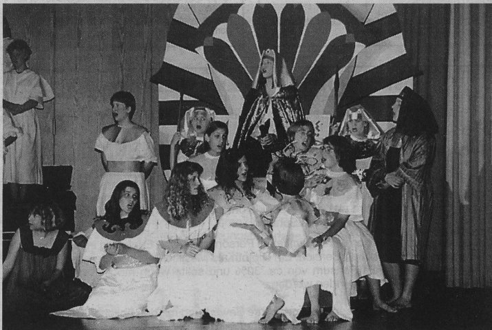
«Pharaoh heisst de König im Land. Er hüt ganz Ägypte fesch i der Hand, regiert mit Umsicht und grossem Verstand, isch in alle n'andré Länder bekannt...»

Vielleicht hat dies das eingangs erwähnte A-capella-Quartett auch schon erfahren. Vielleicht arbeitet es inzwischen in der Produktion von originellen musikalischen Telefonbeantworter-Ansagen oder wird als Beruhigungsmittel im Behandlungszimmer eines musikliebenden Zahnarztes eingesetzt... Franziskus