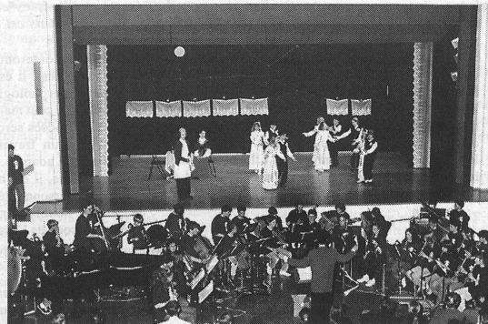
Insgesamt 125 Kinder und Jugendliche der Musikschule Domat/Ems beteiligten sich mit grossem Engagement am Singspiel «Dr muatig Tambour».

Die Musikschule Domat/Ems feiert ihr 20jähriges Bestehen