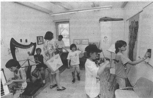
Offene Türen zur Musik.

Anlässlich der Schulhausweihe vom 1./2. Juli 1995 hatte auch die Jugendmusikschule ihre