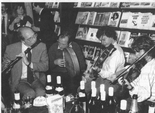
Au terme de ce deuxième Salon de la Musique de Genève, on se demande si la musique et le livre ont effectivement bonne presse.

Wer seine Neugier an der kleinen Musikmesse nicht zu stillen vermochte, konnte sich (ohne Aufpreis) auch die anderen Messen ansehen: die Educa '95 (die 4. Messe für Ausbildung und Unterricht, in deren Rahmen Schulen, Berufsschulen und andere Bildungsinstitute ihre Programme präsentierten), die Europ'Art (die 4. Internationale Messe für alte, moderne und aktuelle Kunst), die Mondolin-gua (die 7. Internationale Messe für Reisen, Sprachen und Kulturen) und natürlich die Internationale Messe für Buch und Presse . Von all diesen Ausstellungen profitierte umgekehrt auch die Musikmesse, denn sie war im Foyer installiert, so dass buchstäblich kein Weg an ihr vorbeiführte. C.Ho.