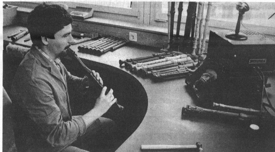
Jede einzelne Blockflöte wird sorgfältig kontrolliert und eingestimmt. Nur was das Gefallen der Flötenbauer findet, darf die Werkstatt verlassen.

Heute ist Kung die einzige Firma in der Schweiz- und auch weltweit eine der wenigen Werkstätten - welche die vollständige Blockflötensfamilie herstellt, nämlich Garklein, Sopranino, Sopran, Alt, Tenor, Bass, Grossbass und Subbass; insgesamt ein Tonumfang von mehr als fünf Oktaven, nämlich vom F bis zum a 4 . Der Name Kung ist in vielen Teilen der Welt ein Synonym für hochstehende Instrumentenbaukunst geworden. Dies wurde nicht zuletzt auch an den gediegenen Jubiläumsveranstaltungen zum 60jährigen Bestehen der Firma deutlich: Die Eglise Réformée Française in Zürich konnte die überaus zahlreiche Besucherschar des Jubiläumskonzertes mit dem Amsterdamer «Loeki Stardust Quartet» kaum fassen, und auch das eigentliche «Geburts-tagsfest» im Casino Schaffhausen mit «Musik vom Mittel- bis zum Nattel-Alter» sowie populärer «Stubete» lockte einen illustren Kreis von Blockflötenliebhabern an. Richard Hafner