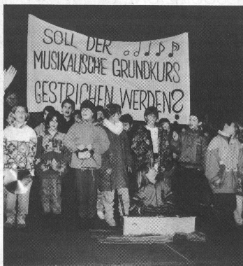
Am 8. Dezember 1993 wurde in Basel eine Petition mit 17 789 Unterschriften eingereicht, welche die Wahrung des 4. Grundkurses an den Primarschulen von Basel fordert.

Wenn man bedenkt, dass der Anteil der Ausländerkinder in der Primarschule von Basel rund 35 Prozent beträgt, wird die soziale und integrierende Funktion des gemeinsamen Musizierens besonders