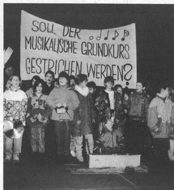
Am 8. Dezember 1993 wurde in Basel eine Petition mit 17 789 Unterschriften eingereicht, welche die Wahrung des 4. Grundkursjahres an den Primarschulen von Basel fordert.

Wenn man bedenkt, dass der Anteil der Ausländerkinder in der Primarschule von Basel rund 35 Prozent beträgt, wird die soziale und integrierende Funktion des gemeinsamen Musizierens besonders