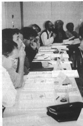
Eine Woche intensive und konzentrierte Ausbildung für Teilnehmer des VMS-Schulleiterschulungskurses zum Thema «Management». Informative und reichhaltige Kursunterlagen vertiefen und festigen den Stoff und ermöglichen eine individuelle Nachbearbeitung des Gelernten im Berufsalltag.