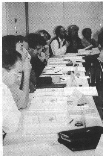
Eine Woche intensive und konzentrierte Ausbildung für Teilnehmer des VMS-Schulleiteraus- bildungskurses zum Thema «Management». Informative und reichhaltige Kursunterlagen vertiefen und festigen den Stoff und ermöglichen eine individuelle Nachbearbeitung des Gelernten im Berufsalltag.