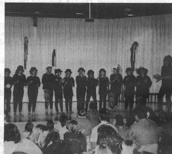
Auch die Musikalische Grundschule trug - hier mit einem lustigen Tanz - zum bunten Angebot der Darbietungen bei.

te am Samstagnachmittag in Moosseedorf ein reichhaltiges Festprogramm beginnen. Im Kirchgemeindehaus, in der Kirche und im alten Schulhaus wurden von den Schülern musikalische Leckerbissen präsentiert, während auf dem Vorplatz die Risottoküche fürs leibliche Wohl sorgte. Für grosse und kleine Kinder gab es ein Musikquiz, eine Klangwerkstatt, Schminken, Glücksfischen und vieles mehr. Abgeschlossen wurde der fröhliche Nachmittag mit der Aufführung des musikalischen Märchens Pezzettino .