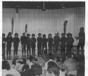
Auch die Musikalische Grundschule trug - hier mit einem lustigen Tanz - zum bunten Angebot der Festdarbietungen bei.

te am Samstagnachmittag in Moosseedorf ein reichhaltiges Festprogramm beginnen. Im Kirchgemeindehaus, in der Kirche und im alten Schulhaus wurden von den Schülern musikalische Leckerbissen präsentiert, während auf dem Vorplatz die Risottoküche fürs leibliche Wohl sorgte. Für grosse und kleine Kinder gab es ein Musikquiz, eine Klangwerkstatt, Schminken, Glücksfischen und vieles mehr. Abgeschlossen wurde der fröhliche Nachmittag mit der Aufführung des musikalischen Märchens Pezzettino .