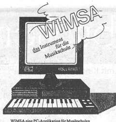
WIMSA eine PC-Applikation für Musikschulen