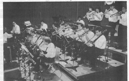
Der Swing der Big Band der Liechtensteinischen Musikschule wusste zu gefallen.