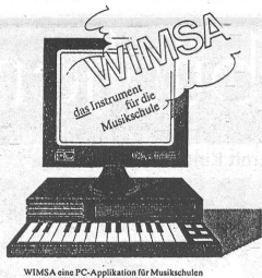
WIMSA eine PC-Applikation für Musikschulen