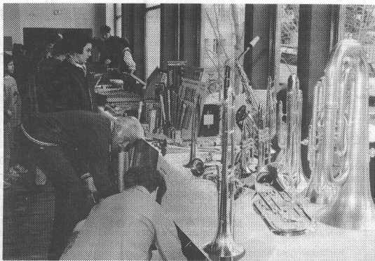
Am Musikschultag «25 Jahre Musikschule Oberengadin» wurde eine reichhaltig bestückte Instrumentenausstellung präsentiert.