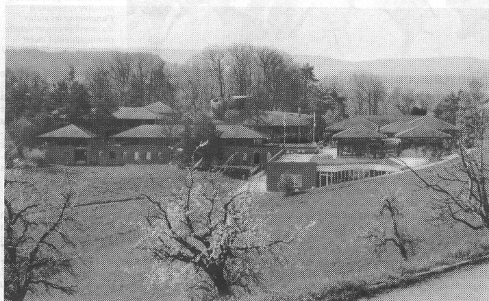
Die evangelische Heimstätte Leuenberg ob Hölstein im Waldenburger Tal (BL) erhielt einen zusätzlichen Anbau (vorne rechts). Der Ort bietet ideale Voraussetzungen zur Durchführung der VMS-Schulleiterkurse.

weiterentwickelte Fähigkeiten zum Ausdruck kommen.