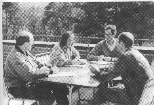
Für die selbständig zu lösenden Gruppenarbeiten suchte man gerne einen attraktiven Platz im Freien.