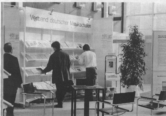
Dans la «Galleria», les écoles de musique allemandes présentent leurs activités. In der «Galleria» informierte der VdM über die Musikschularbeit in Deutschland.

Animato berichtet über das Geschehen in und um Musikschulen. Damit wir möglichst umfassend orientieren können, bitten wir unsere Leser um ihre aktive Mithilfe. Wir sind interessiert an Hinweisen und Mitteilungen aller Art sowie auch an Vorschlägen für musikpädagogische Artikel.