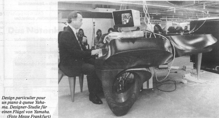
Design particulier pour un piano à queue Yamaha. Designer-Studie für einen Flügel von Yamaha.