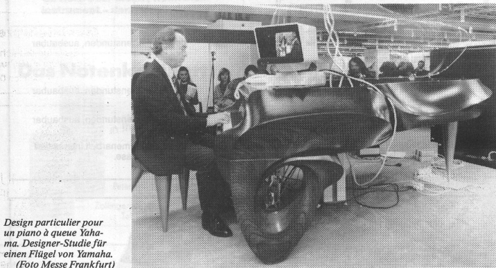
Design particulier pour un piano à queue Yamaha. Designer-Studie für einen Flügel von Yamaha.