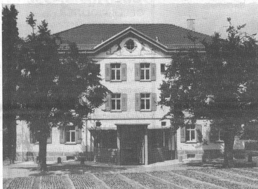
Das umgebaute ehemalige Rorschacher Waisenhaus beherbergt nun die Jugendmusikschule Rorschach-Rorschacherberg.