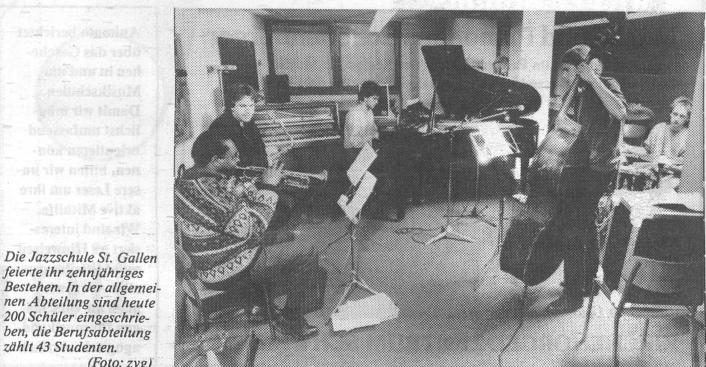
Die Jazzschule St. Gallen feierte ihr zehnjähriges Bestehen. In der allgemeinen Abteilung sind heute 200 Schüler eingeschrieben, die Berufsabteilung zählt 43 Studenten.

Fast gleichzeitig mit der Jazzschule begann die Reihe «Musik in der Klubschule». Anfänglich musizierten vorwiegend aus Lehrern gebildete Ad-hoc-Gruppen im Musiksaal der St. Galler Klubschule. Dann entschieden sich die Organisatoren für ein neues Konzept. Es sollten nur noch bestehende Gruppen eingeladen werden, gleichzeitig wurden die musikalischen und geographischen Grenzen geöffnet. In den rund 70 bisher durchgeführten Konzerten gab es sowohl Jazz wie improvisierte und auch ethnische Musik zu hören. Zu den Höhepunkten der ersten Kategorie gehören die verschiedenen Auftritte der welschen BBFC-Musiker oder die zahlreichen Auf Art Lande-Konzerte, in der zweiten steht die Zusammenarbeit mit Irène Schweizer in unterschiedlichen Besetzungen heraus. Im Bereich Ethno- und Volksmusik sind Flamenco- und Tangokonzerte, ebenso die Auftritte von zwei indischen Gruppen, in diesem Jahr besonders erwähnenswert. Mindestens ein Konzert pro Jahr ist für Gruppen aus dem Welschland reserviert.