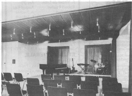
Bei den Umbauarbeiten waren vor allem die Massnahmen für den optimalen Schallschutz und die Raumakustik von Bedeutung.