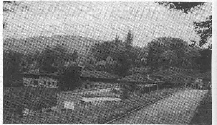
Die neu durch einen Erweiterungsbau ergänzte ev. Heimstätte ob Hölstein im Waldenburgerthal (BL) bot ideale Bedingungen zur Durchführung des Schulleiterschulungskurses.

Musikschulpolitik und Öffentlichkeitsarbeit. Dazu bot der Kurs beispielsweise eine Einführung in die Art und Weise der politischen Argumentation, Ratschläge für den praktischen Alltag und eine Darstellung der verschiedenen Möglichkeiten, den Stellenwert der Musikschule und ihr Image in der Öffentlichkeit zu verbessern. Kurz gesagt, alles was – in doppeltem Sinne – zum «Handwerk des Trommels» gehört, wurde angesprochen, nicht ohne den Hinweis auf die auch für die Musikschularbeit unabdingbare Voraussetzung von Qualität und Professionalität. Dazu dienen letztlich auch die VMS-Schulleiterkurse, welche speziell das geschickte menschliche Verhalten (Aufbaukurs 1), ein breites Grundlagenwissen im fachlichen Bereich und gewandtes politisches Benehmen in der Öffentlichkeit (Aufbaukurs 2) sowie die gute Administration und Organisation (Aufbaukurs 3) zwar nicht garantieren, aber doch erleichtern helfen. Der hohe Anteil von spontanen positiven Rückmeldungen der Teilnehmer bestätigte, dass die beiden verantwortlichen Kursleiter, VMS-Präsident Willi Renggli und Armin Brenner , ein praxisgerechtes Schulungsangebot zusammenstellen. Die Ruhe und Abgeschlossenheit in der reizvollen Juralandschaft bildete nicht nur eine farbige herbstliche Kulisse, sie förderte auch die geistige Konzentration auf wesentliche Fragen der beruflichen Aufgabe. Im folgenden schildern drei Kursbesucher ihre persönlichen Eindrücke und Überlegungen. RH