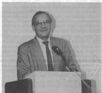
Joseph Frommelt, Präsident der Europäischen Musikschul-Union.

Auch an der diesjährigen Konferenz haben die Delegierten die verschiedenen Länderberichte mit grossem Interesse zur Kenntnis genommen. Besondere Aufmerksamkeit erhielten die Berichte von Kroatien und Litaunien. Die Delegierte aus Kroatien schilderte ein bedrückendes Bild ihrer Musikschulen. Von 54 Schulen wurden 6 während der kriegerischen Auseinandersetzungen total und zahlreiche Musikschulen teilweise zerstört. Der Schaden und