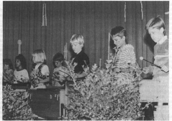
Rund 170 Musikschüler aller Fächer boten unter dem Motto «Eine musikalische Weltreise» einem über 600 Personen zählenden Publikum einen begeisternden Querschnitt durch das vielfältige Angebot der Musikschule Werdenberg.

alle umfasste. Begonnen wurde mit einem Beitrag von Grundschulkindern, der eine Publikumsanimation einschloss. Es war übrigens erstaunlich zu beobachten, dass sich spontan eine grosse Anzahl Kinder aus dem Publikum angesprochen fühlte. Das Vororchester überbrachte anschliessend musikalische «Postkartengrüsse». Die Schweiz wurde im Rahmen der besagten «Weltreise» von einer Kindervolkstanzgruppe und einem Instrumentalensemble sowie einer «urchigen» Schwyzerörgelformation und zu späterer Stunde durch eine Lehrerländerkapelle vertreten. Das hauseigene Ballett präsentierte sich mit verschiedenen Folkloretänzen aus aller Welt und mit einem Jazztanz. Südamerika wurde, wie könnte es anders sein, durch ein fetziges und rhythmusgeladenes Perkussionsensemble vorgestellt. Das Jugendorchester und ein Pianist vermittelten eine imaginäre «Skyline» einer amerikanischen Grossstadt mit Gershwins «Rhapsody in Blue».