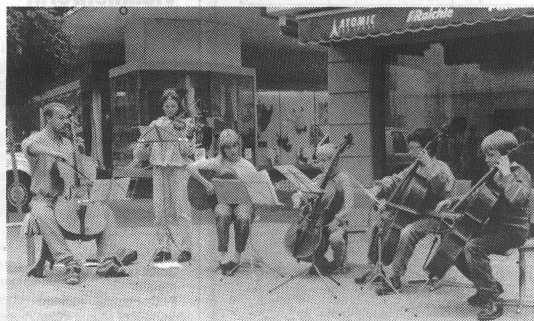
Auch mit zarter klassischer Gitarrenmusik wagten sich Lehrer und Schüler auf die Strasse – und fanden aufmerksame Zuhörer.