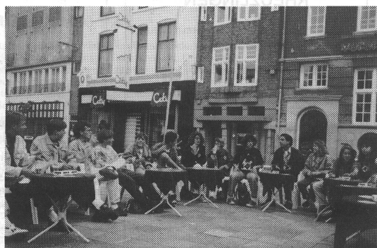
Treffpunkt auf dem Stadtbummel in Eindhoven. Nach und nach erweiterte sich die Tischrunde.

Urs: Mir imponierten vor allem die einheitlichen Velos, die Backsteinhäuser und das PSV-Stadion. Es war schon toll, vor so vielen Leuten zu konzertieren und die verschiedenen Musikgruppen aus ganz Europa zu hören.