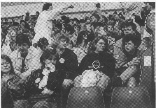
Da braucht es auch interne Organisation: Das JSO Schwyz mit 85 Teilnehmern war die grösste Formation am Musikfest.