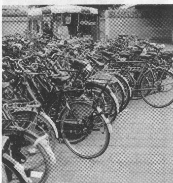
Für die Distanz zwischen Gastfamilie und Konzert/Probenort bot sich auch für die jugendlichen Musikanten das Velo als Verkehrsmittel an.