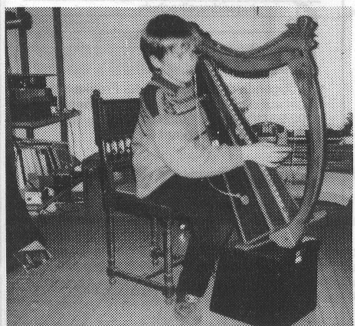
Die keltische Harfe eignet sich besonders gut auch für Kinder.

Gemäss der keltischen Tradition wurde das Repertoire der Harfe auf oralem Wege weitergegeben. Diese Tendenz hat sich bis heute in den bereits genannten Ländern erhalten. In Irland war es sogar teilweise verboten, Harfe zu spielen. Die Machthaber wollten die keltische Tradition unterbinden und erlaubten deshalb nur Blinden, dieses Instrument zu spielen. Diese aber gaben ihr Können mündlich trotzdem weiter. Erst in neuerer Zeit haben keltische Harfenisten begonnen, ihre Musik auch aufzuschreiben.