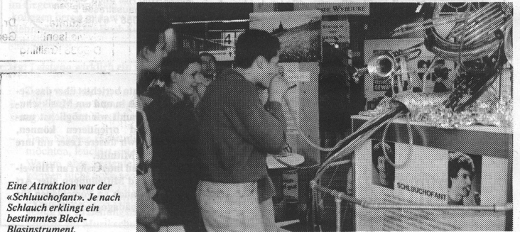
Eine Attraktion war der «Schluchofant». Je nach Schlauch erklingt ein bestimmtes Blechblasinstrument.