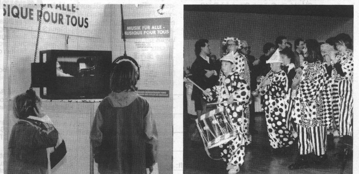
Videofilm über eine Klavierstunde.