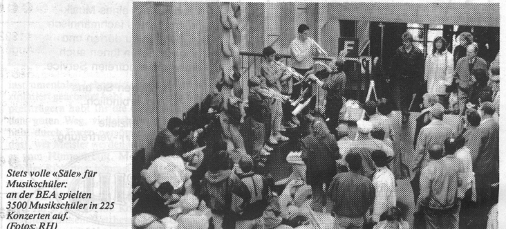
Stets volle «Säle» für Musikschüler: an der BEA spielten 3500 Musikschüler in 225 Konzerten auf.