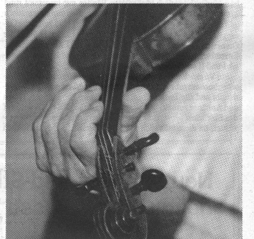
Die Technik muss sich den besonderen körperlichen Bedingungen anpassen.

Achtzigjährige Musikschüler sind sicher eine grosse Ausnahme und der Unterricht ist ganz besonders auf die Person und ihre Möglichkeiten zugeschnitten. In meiner Violinklasse befinden sich aber auch noch erwachsene Schüler zwischen vierzig und siebzig Jahren. Während die Jüngeren be-