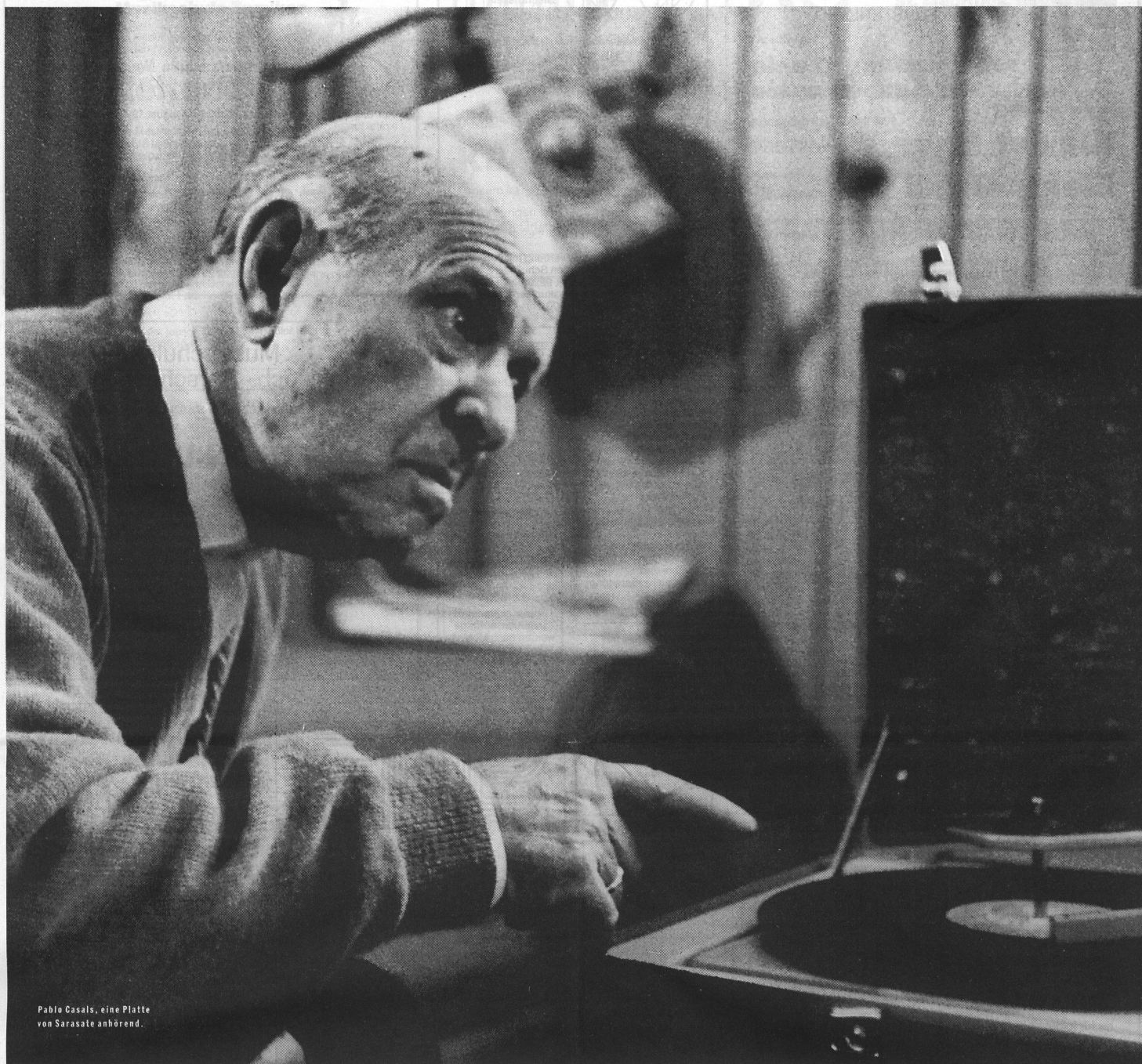
Pablo Casals, eine Platte von Sarasate anhörend.

Hommage an die Schallplatte: Noch nie zuvor hatte Pablo Casals die Wiedergabe seiner Aufnahmen in so vollendeter Reinheit und Unverfälschtheit vernommen. Wie hätte er auch ahnen können, dass noch im selben Jahrhundert mit der digitalen Aufnahme- und Wiedergabetechnik eine neue Ära eingeläutet werden