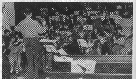
Das Dreiländerensemble probt unter der Leitung von C. Brendel in der Kirche von Munster im Elsass

GENERALDIREKTION, 16, AV. EUGÈNE-PITTARD, 1211 GENÈVE 25, TEL. 022/479222