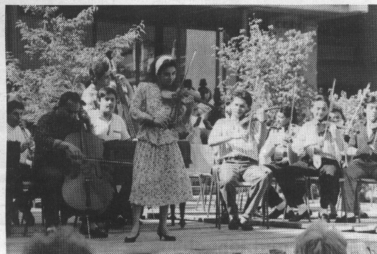
Das ungarische Jugendensemble «Raikó Kapelle» aus Budapest.

avons gardé le contact avec nos hôtes et nous espérons bien les revoir. Nous avons tous préféré loger dans des familles plutôt que de loger dans un centre. Nous n'avons pas eu de problèmes de langue, le contact était si naturel!