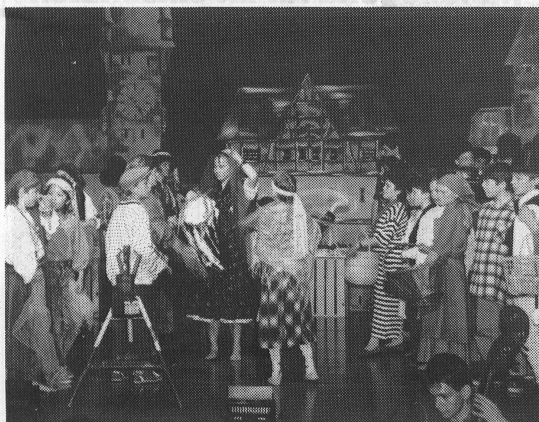
«Das Geheimnis um den Wagen», ein Schüler-Musical mit gesellschaftspolitischem Inhalt.