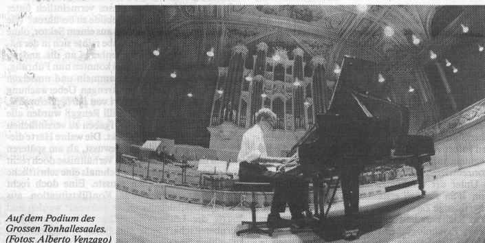
Auf dem Podium des Grossen Tonhalleaals.

drei namhaften Personen, die mit sorgfältig und liebevoll gestalteten Wunschzetteln, ähnlich wie sie bei Hochzeiten verwendet werden, persönlich bei Industrie und Gewerbe für die Anliegen der Musikschule warben. Grosse Bedeutung misst die Leitung der JMF den vielen und verschiedensten Aktivitäten seitens der Musikschule bei. So war die Jahresversammlung begleitet von einem Benefizkonzert der Lehrerschaft . Vom gutbesuchten Informationsnachmittag floss der Erlös aus dem Verkauf von Kuchen und Kaffee in den Instrumentenfonds. Neben der bereits bestehenden Compact Disc des Klarinettenquintetts der JMF wurde von der Lehrerschaft eine Musikkassette eingespielt , die einen musikalischen Querschnitt durch das ganze Angebot der JMF bietet. Als Werbeträger wurden «Geschicklichkeits-Würfel» mit dem Signet der JMF versehen und bestens verkauft. Während der Aktivitätenwoche wurden täglich zur selben Zeit in der Altstadt von Frauenfeld Schülerkonzerte dargeboten.