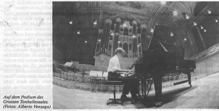
Auf dem Podium des Grossen Tonhallsaales.

drei namhaften Personen, die mit sorgfältig und liebevoll gestalteten Wunschzetteln, ähnlich wie sie bei Hochzeiten verwendet werden, persönlich bei Industrie und Gewerbe für die Anliegen der Musikschule warben. Grosse Bedeutung misst die Leitung der JMF den vielen und verschiedensten Aktivitäten seitens der Musikschule bei. So war die Jahresversammlung begleitet von einem Benefizkonzert der Lehrerschaft. Vom gutbesuchten Informationsnachmittag floss der Erlös aus dem Verkauf von Kuchen und Kaffee in den Instrumentenfonds. Neben der bereits bestehenden Compact Disc des Klarinettenquartetts der JMF wurde von der Lehrerschaft eine Musikkassette eingespielt, die einen musikalischen Querschnitt durch das ganze Angebot der JMF bietet. Als Werbeträger wurden «Geschicklichkeits-Würfel» mit dem Signet der JMF versehen und bestens verkauft. Während der Aktivitätenwoche wurden täglich zur selben Zeit in der Altstadt von Frauenfeld Schülerkonzerte dargeboten.