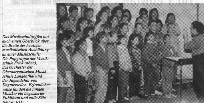
Das Musikschultreffen bot auch einen Überblick über die Breite der heutigen musikalischen Ausbildung an einer Musikschule: Die Popgruppe der Musikschule Frick (oben), das Orchester der Oberaargauischen Musikschule Langenthal und der Jugendchor von Dagmersellen. Erfreulicherweise fanden die jungen Musiker ein begeistertes Publikum und volle Säle.