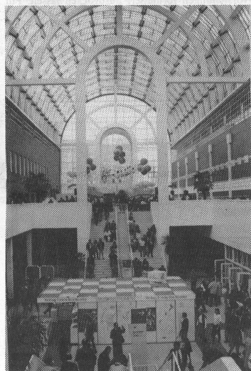
Die «Galleria», das Zentrum der Messe. Raum für Konzerte und Ausstellungen. Auch der Verband deutscher Musikschulen war hier mit einem Informationsstand vertreten.

Der neue professionelle Light&Sound-Sektor erweiterte das ohnehin schon reichhaltige Angebot.