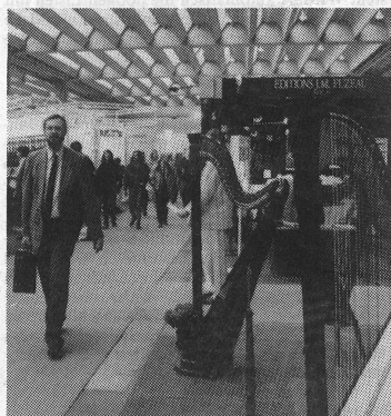
Sorgfältig, oftmals geradezu mit Stil, präsentierten sich die traditionellen Instrumentenhersteller und Musikverlage.

Neben Tonstudio-Einrichtungen konnte man alle Arten von Laserlichttechnik über sich ergehen lassen. Im Zentrum des Publikumsinteresses stand wiederum die Elektronik und hier vor allem der stark erweiterte Ausstellungsbereich Musikcomputer. In einem eigenen Piano-Salon präsentierten gegen 100 Hersteller traditionelle Tasteninstrumente und deren Zubehör. Steinway zeigte seinen speziell kreierten 500 000sten Flügel, und Bösendorfer hatte mit dem exklusiv entworfenen «Hollein-Flügel», welcher als teuerster Flügel (rund 160 000 Franken) in limitierter Anzahl sogar käuflich ist, einen Publikumsmagneten. Neben dem Trend zu Designexklusivitäten und Spezialmodellen ist eine gegenläufige Strömung auszumachen, hin zu äusserlich sparsam gestalteten Flügeln, die gegenüber den normalen Modellen deutlich billiger sind. Insgesamt zeichneten sich die Hersteller traditioneller Instrumente vor allem durch Detail- und Modellpflege aus. Im Gegensatz zum Gedränge auf den drei Etagen der Halle 9, welche ganz den elektronischen Instrumenten samt Zubehör reserviert war, ging es in den beiden übrigen Hallen mit den akustischen Instrumenten und den Musikverlagen bedeutend ruhiger her und zu. Trotzdem wurde aber bemerkt, dass sich die traditionellen Musikinstru-