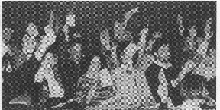
Das Tätigkeitsprogramm 1990/91 wird genehmigt.