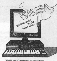
WIMSA eine PC-Applikation für Musikschulen

Zürich, Basel, Luzern, St. Gallen, Winterthur, Solothurn, Lausanne, Neuchâtel, Sion