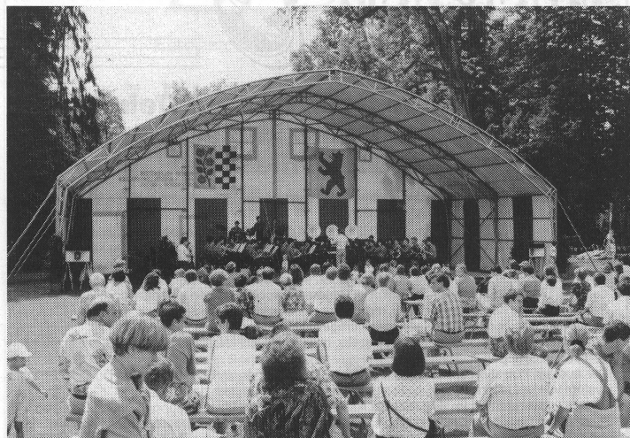
Das Bühnenszelt spendete den Musikanten Schatten und garantierte gleichzeitig für vorteilhafte akustische Bedingungen.

Höhepunkt der Veranstaltungen zum Jubiläum «25 Jahre Musikschule Cham»