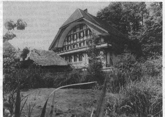
Die Kulturmühle Lützelflüh im Emmental.

Die Kulturmühle ist mit 1,2 Millionen Franken hoch verschuldet und zahlungsunfähig. Selbst der Lohn für die Leiterin konnte seit drei Monaten nicht mehr bezahlt werden. Weitere Stellen mussten gestrichen werden. Mit lediglich einer sanierungsbedürftigen Liegenschaft ohne Anfangs- und Betriebskapital bei einem jährlichen Betriebsdefizit von 70 000 (1987) bis 260 000 (1985) bei einem jährlichen Aufwand von ca. 500 000 Franken, war der Kollaps fast zwangsläufig. Ob der Kanton Bern bereit ist, mehr als die bisher von 70 000 auf 120 000 Franken erhöhten Beiträge zu leisten, ist noch offen. Im Augenblick hängt das Schicksal der Institution an einem dünnen Faden. Es wäre schade, wenn dieses Stück gelebte Utopie Vergangenheit würde. RH