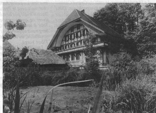
Die Kulturmühle Lützelflüh im Emmental.

Die Kulturmühle ist mit 1,2 Millionen Franken hoch verschuldet und zahlungsunfähig. Selbst der Lohn für die Leiterin konnte seit drei Monaten nicht mehr bezahlt werden. Weitere Stellen mussten gestrichen werden. Mit lediglich einer sanierungsbedürftigen Liegenschaft ohne Anfangs- und Betriebskapital bei einem jährlichen Betriebsdefizit von 70 000 (1987) bis 260 000 (1985) bei einem jährlichen Aufwand von ca. 500 000 Franken, war der Kollaps fast zwangsläufig. Ob der Kanton Bern bereit ist, mehr als die bisher von 70 000 auf 120 000 Franken erhöhten Beiträge zu leisten, ist noch offen. Im Augenblick hängt das Schicksal der Institution an einem dünnen Faden. Es wäre schade, wenn dieses Stück gelebte Utopie Vergangenheit würde. RH