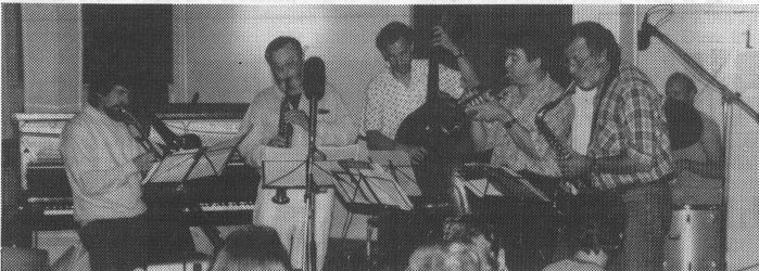
JMSA All Stars, die ad hoc verstärkte, spürbar gut gelaunte Lehrband der Jugendmusikschule Amt.

Der Abend hatte Stimmung. Nicht nur für die Musik, auch für das leibliche Wohl war mit einer gut organisierten Equipe vorgesorgt. Wir hoffen, dass unsere Bilder vom Jugend Jazz-Treffen in Affoltern etwas von der Atmosphäre einfangen konnten. RH