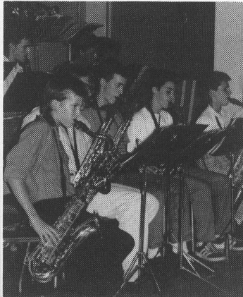
Das Saxophon-Register des Jazz & Rock-Ensembles der Jugendmusikschule Amt in voller Fahrt.