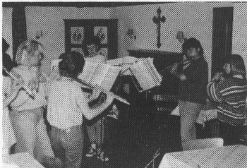
Impressionen aus dem Musiklager der Musikschule Frick im Schloss Schwandegg in Menzingen ZG.

In diesem Jahr wurde die Musikschule Frick zehnjährig. Die Jubiläumsveranstaltungen begannen mit einem Adventskonzert im Dezember 1988. Nach einem Südamerika-Konzert, an dem eine Kollekte über Fr. 9000,- für ein Entwicklungshilfeprojekt in Ecuador erbrachte, folgte ein Musiklehrerkonzert in drei Teilen, nämlich einem üblichen Konzert-