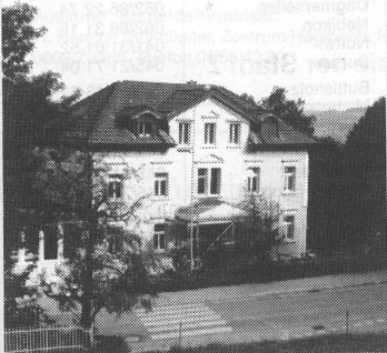
Das neue Domizil der Musikschule Herisau.

Angeregt durch eine Motion im Einwohnerrat wurden im Jahre 1978 von einer speziellen Kommission unter Leitung des Schulpräsidenten die Vor-