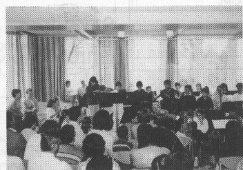
Die Aula, ausgestattet mit einem Bösendorfer-Flügel, bietet rund 100 Besuchern Platz.

Die neue Musikschule in der Steinegg schenkt uns einen optimalen Rahmen, «unsere» Musik und mit ihr unser Menschsein der Jugend weitergeben zu können. Wir verfügen über individuell ausgestattete Unterrichtszimmer, über Gruppenräume, über einen angemessenen, gediegenen Konzertsaal und über wohlklingende Instrumente. Wir können