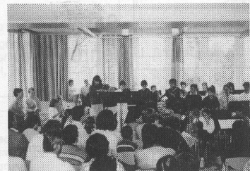
Die Aula, ausgestattet mit einem Bösendorfer-Flügel, bietet rund 100 Besuchern Platz.

Die neue Musikschule in der Steinegg schenkt uns einen optimalen Rahmen, «unsere» Musik und mit ihr unser Menschsein der Jugend weitergeben zu können. Wir verfügen über individuell ausgestattete Unterrichtszimmer, über Gruppenräume, über einen angemessenen, gediegenen Konzertsaal und über wohlklingende Instrumente. Wir können