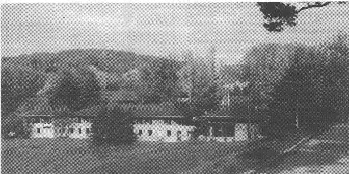
Die ev. Heimstätte Leuenberg ob Hölstein im Waldenburger Tal (BL) bot ideale Bedingungen zur Durchführung des Schulleiterrausbildungskurses VMS.