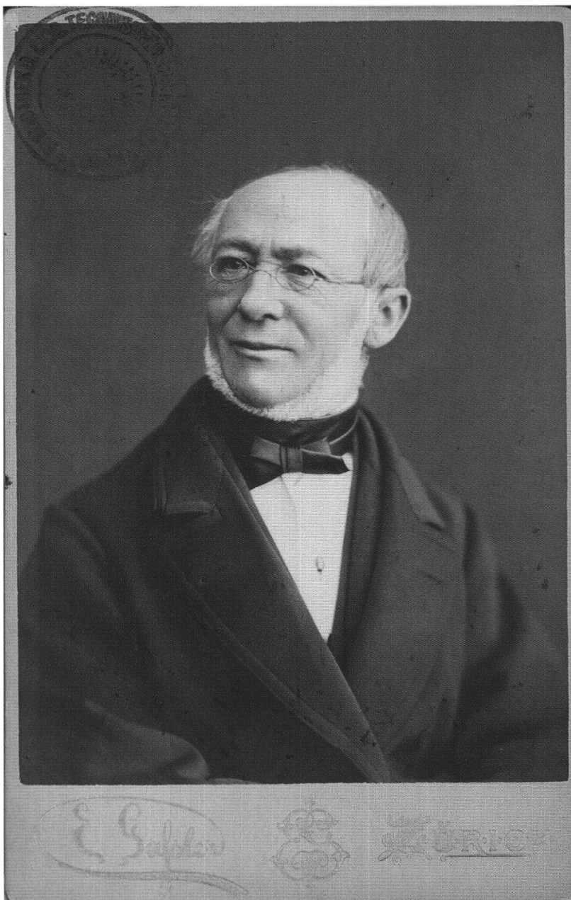
Abb. 14: JOHANNES WILD VON RICHTERSWIL (1814 – 1894), PHOTOGRAPHIE. WILD WAR NACH SEINER FUNKTION ALS LEITER DER SCHAFFUNG DER WILDKARTE VON 1855 – 1889 PROFESSOR FÜR TOPOGRAPHIE UND GEODÄSIE (VERMESSUNG) AN DER ETH IN ZÜRICH.

Ein Lob zur „WILDKarte“: DUFOUR schrieb am 5. August 1853, nach Übersendung der ersten vier Blätter nach Zürich: „Die Genauigkeit dieser Blätter ist vollkommen und lässt bezüglich Klarheit und Feinheit nichts zu wünschen übrig; sie macht dem Stecher, wie den Ingenieuren und Zeichnern gleiche Ehre. Indem Sie Ihre Karte im gleichen Massstab wie diejenigen der Aufnahmen, d. h. 1 : 25'000, publizieren, mit dem System der Horizontalkurven, welche so genau aufgenommen und wiedergegeben sind, dass sie nicht mit andern Strichen verwechselt werden können, haben