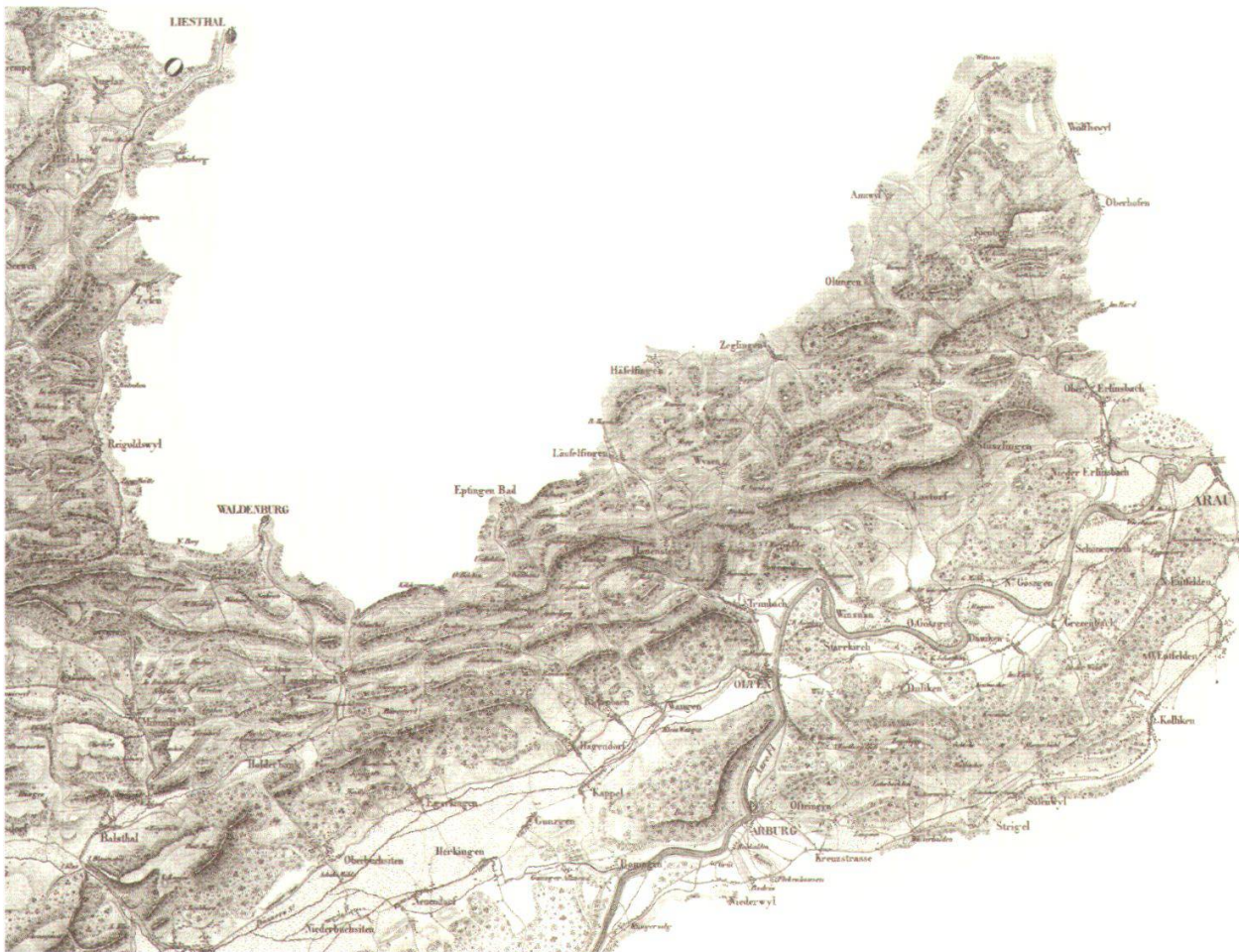
Abb. 26: Der Osten des Kantons Solothurn auf der ‚WALKERkarte‘ (c. Kartensammlung der Zentralbibliothek Zürich, c. AGIS).

ketten einen schmalen, weissen Grat und bekommen die Ausprägung von Raupen. Diese Geländedarstellung wirkt unnatürlich.