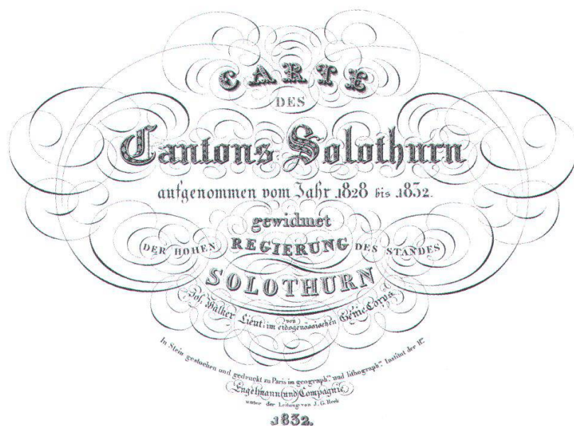
Abb. 24: Titel der WALKERkarte von 1832 im damaligen traditionellen, barocken und verschnörkelten Stil.

Wie Abbildung 25 zeigt, wurde die Karte in einer sehr feinen Schraffenmanier gezeichnet. Am Südhang des Weissensteins erkennt man eine frühe Form der Felszeichnung (schwarze, kleine, nussgipfelförmige oder fischförmige Girlanden). Die Karte ist zweifarbig gedruckt, allerdings auf gelblichem Papier. Die Beleuchtung ist senkrecht. Dadurch wird das Relief zu wenig hervorgehoben. So erhalten die Jura-