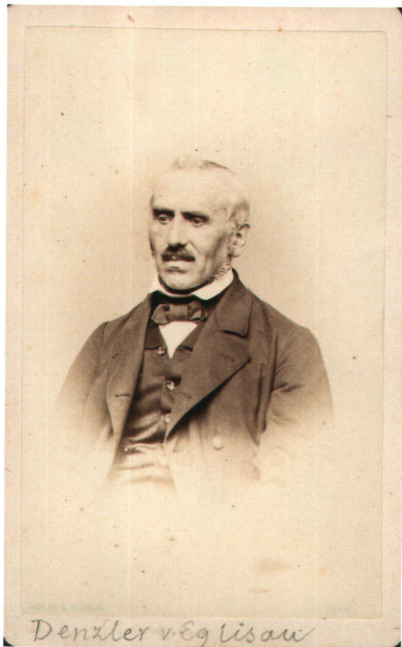
Abb. 20: JOHANN HEINRICH DENZLER (1814 – 1876), Photographie.

gung, Verschiebung oder Entfernung der Vermessungssignale. Im Amtsblatt wird offiziell unter Strafandrohung vor der Beschädigung von Signalen gewarnt.