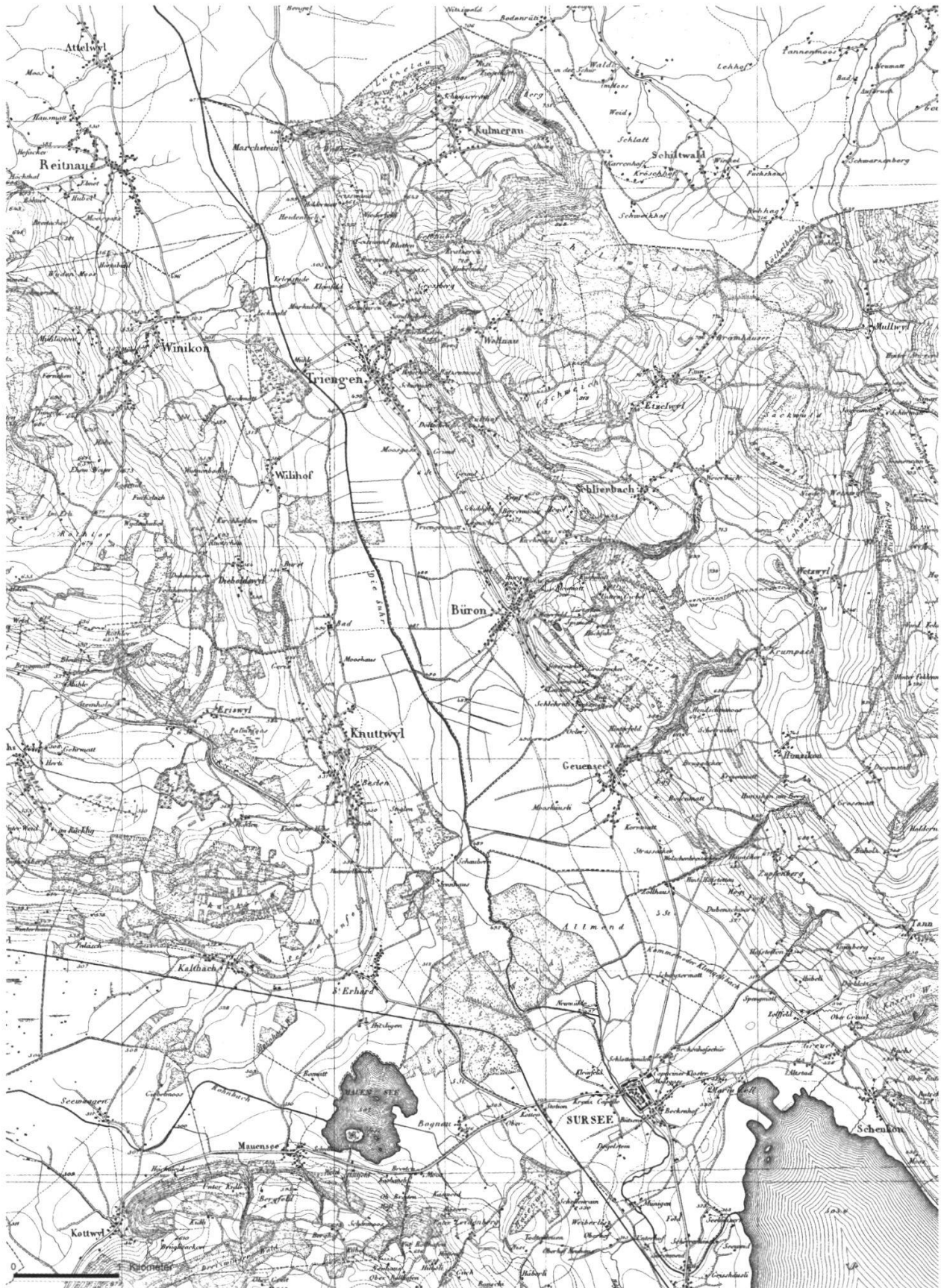
Abb. 18: Topographische Karte des Kantons Luzern 1 : 25'000 (1864 - 1867) ohne Relief mit Höhenkurven. Das luzernische Suhrental.