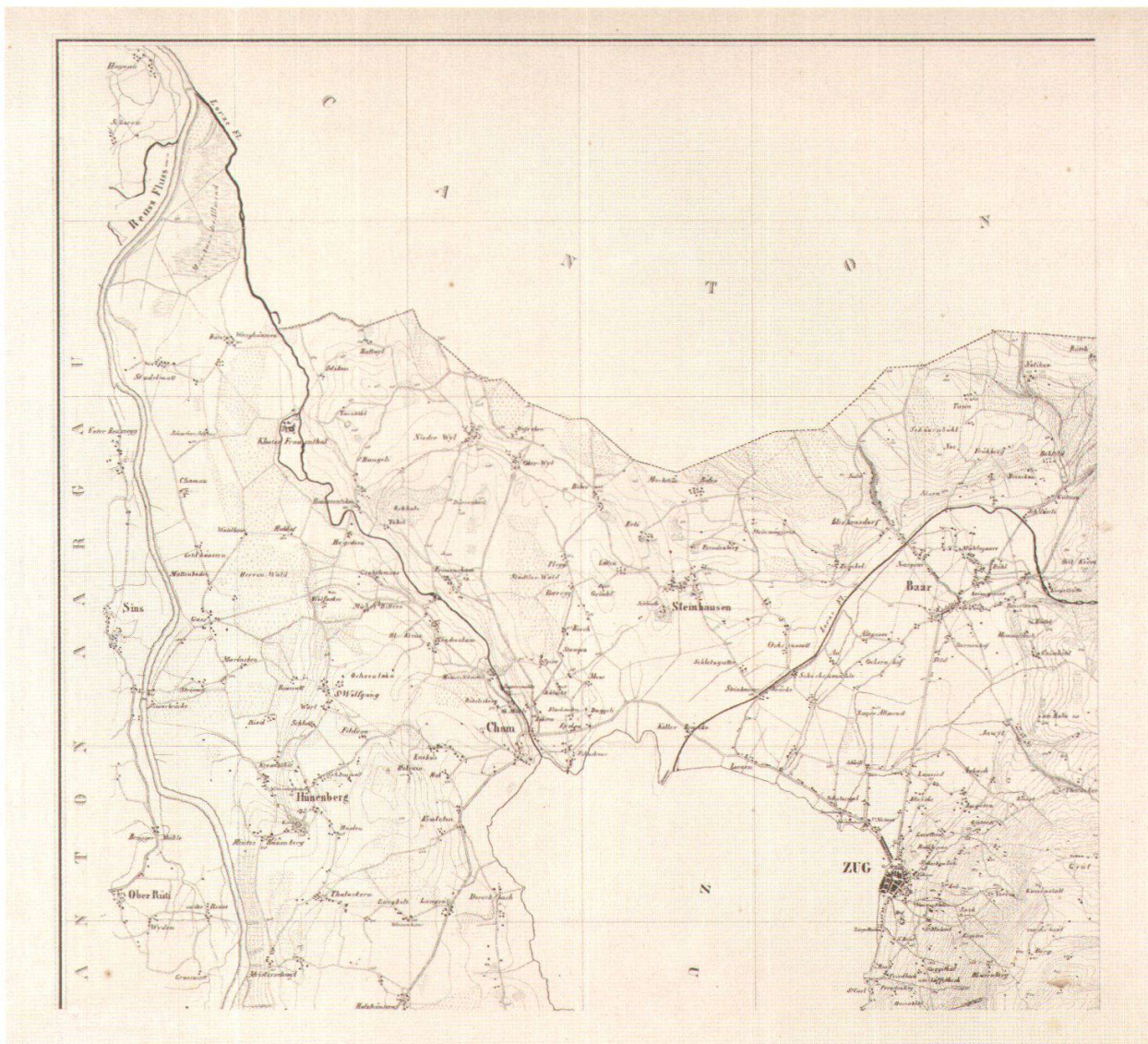
Abb. 17: Der Nordwesten der Kantons Zug auf der ‚ANSELMIERKarte‘.