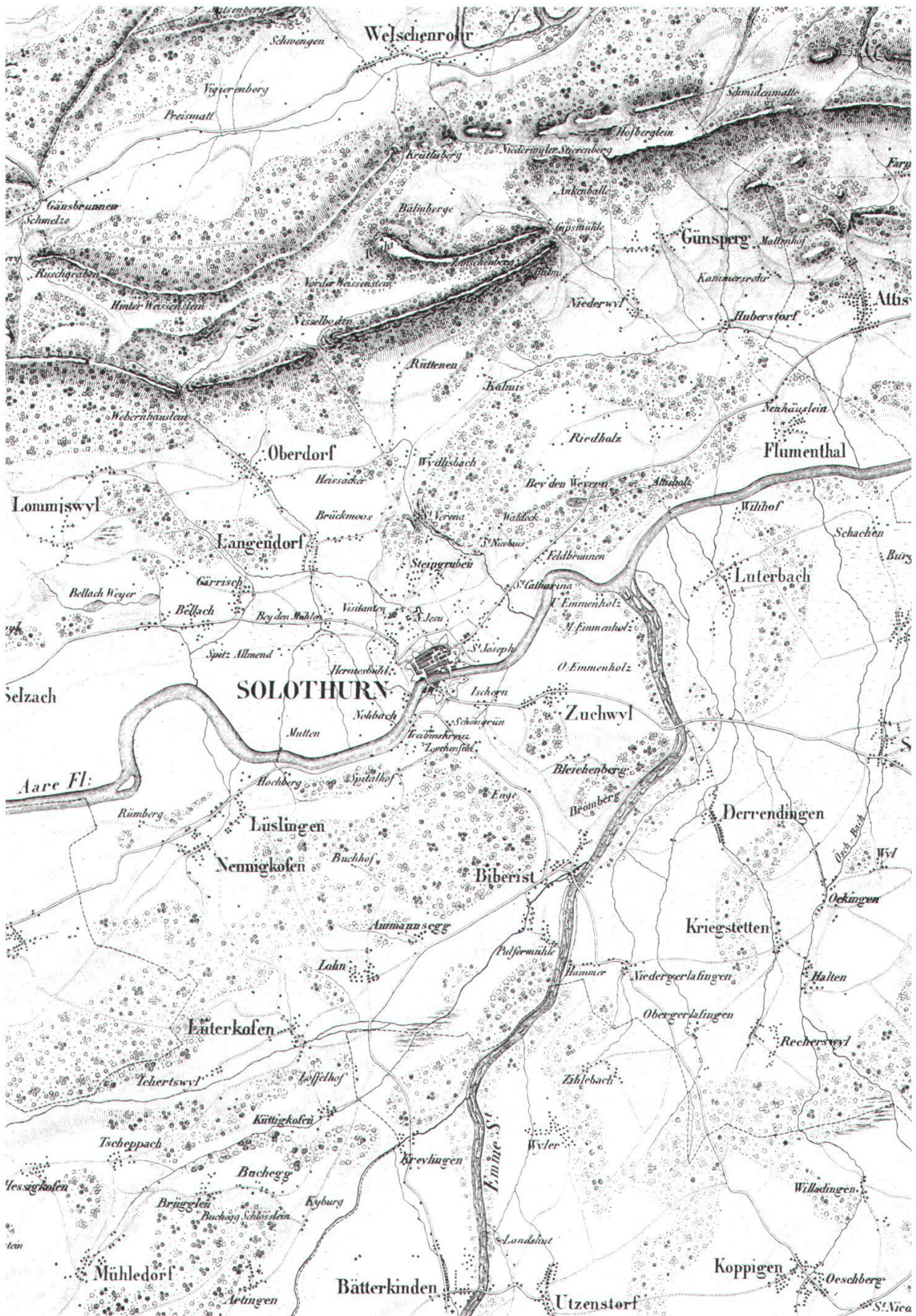
Abb. 25: Kantonskarte von URS JOSEF WALKER (1832). Ausschnitt der Region Solothurn und dem Tal der unteren Emme. Aus WALLNER (1995: 15).