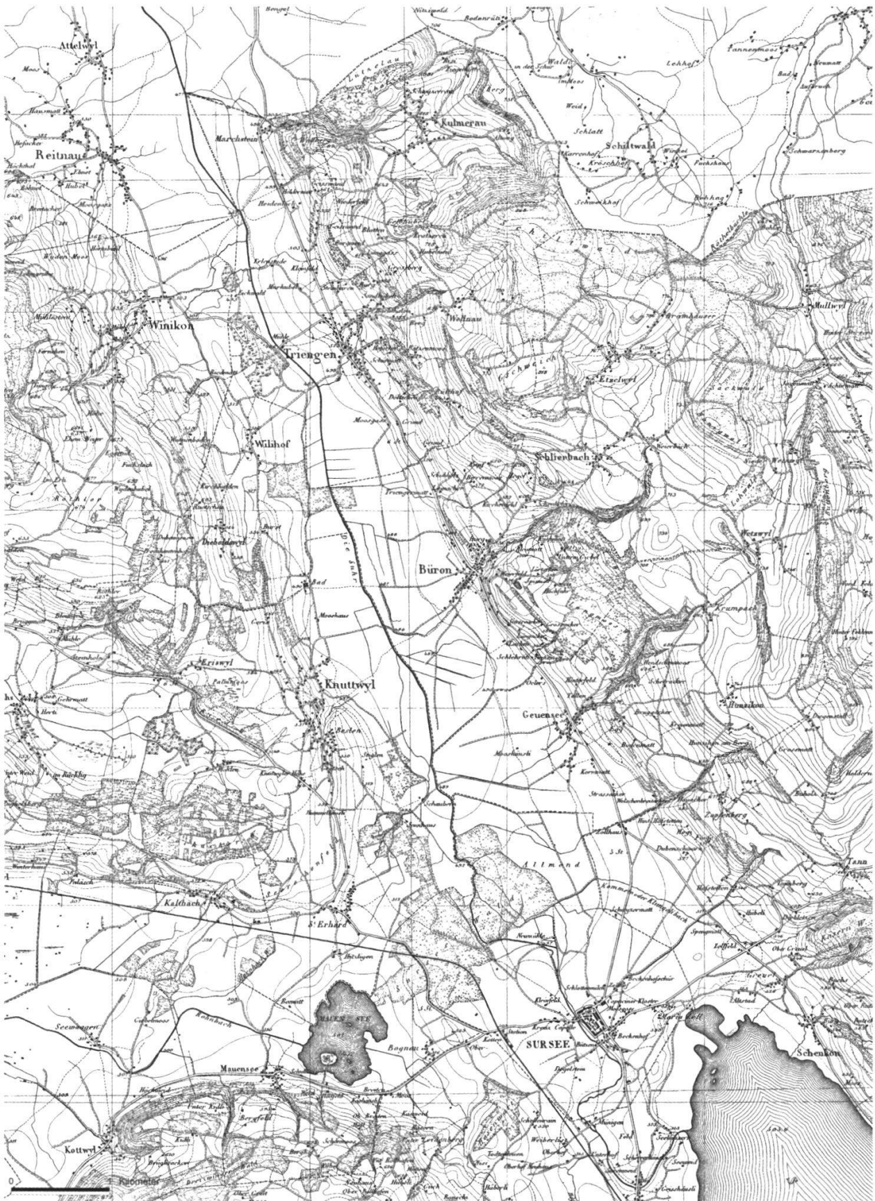
Abb. 18: Topographische Karte des Kantons Luzern 1 : 25'000 (1864 - 1867) ohne Relief mit Höhenkurven. Das luzernische Suhrental.