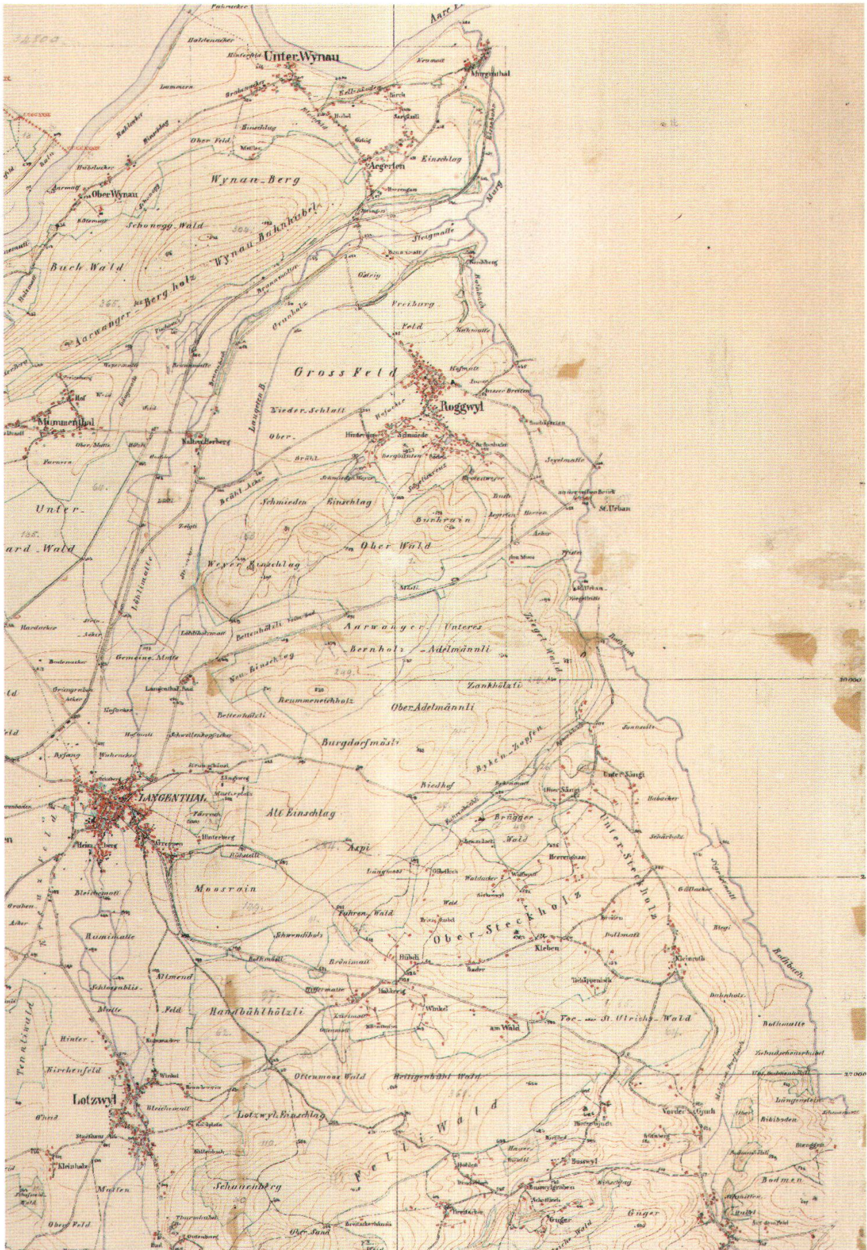
Abb. 21: Der nordöstlichste Teil des Blattes 1 der DENZLERkarte des Kantons Bern 1 : 25'000, aufgenommen 1857.