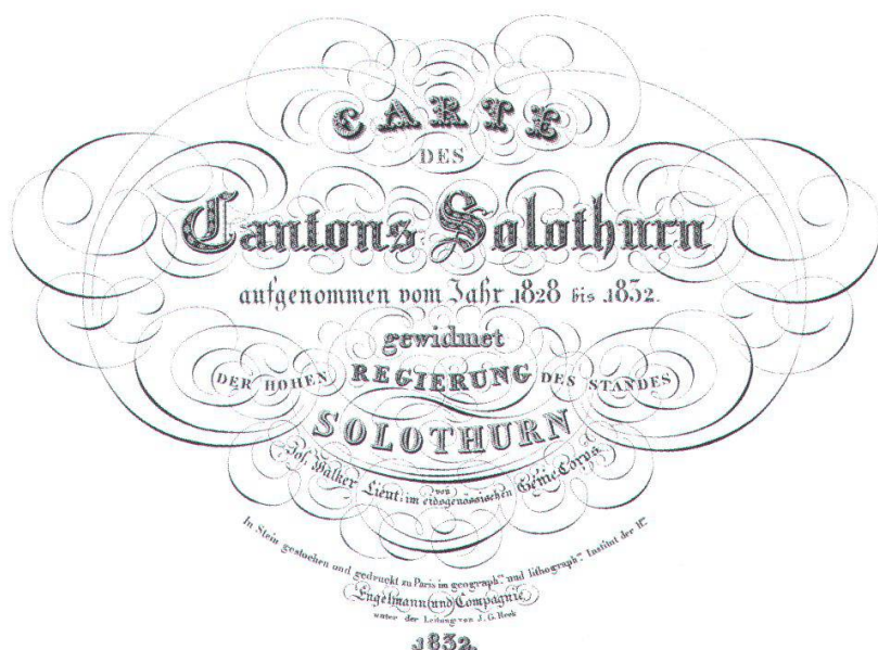
Abb. 24: Titel der WALKERkarte von 1832 im damaligen traditionellen, barocken und verschnörkelten Stil.

Wie Abbildung 25 zeigt, wurde die Karte in einer sehr feinen Schraffenmanier gezeichnet. Am Südhang des Weissensteins erkennt man eine frühe Form der Felszeichnung (schwarze, kleine, nussgipfelförmige oder fischförmige Girlanden). Die Karte ist zweifarbig gedruckt, allerdings auf gelblichem Papier. Die Beleuchtung ist senkrecht. Dadurch wird das Relief zu wenig hervorgehoben. So erhalten die Jura-