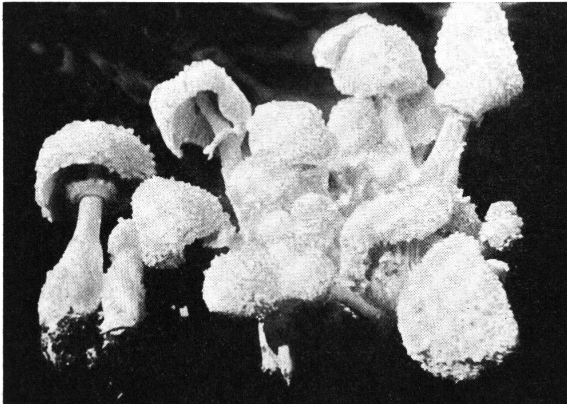
Abb. 2. Lepiota cretata LOCQUIN

Beobachtungen: Auch diese Art wurde in der Literatur sehr verschieden interpretiert. Sie entspricht derjenigen BULLIARDS mit der Einschränkung, daß sie flockiger und weißer ist. Die etwas graue Abbildung BULLIARDS entspricht aber nicht ganz seiner Beschreibung, wenn er selbst die Flocken als «pelucheux-cotonneux» und «blanc de craie» bezeichnet. Gute Abbildungen finden sich bei MATTIROLO, COOKE und «Mykologia» (Prag). Für SOWERBY war die cepaestipes eben noch eine Kollektivart und umfaßte weiße, braunschuppige und gelbe Formen. Nachdem GODFRIN Lepiota lutea als gute Art abgegrenzt hat (siehe oben), erhebt der bekannte Lepiota -Forscher M. LOCQUIN (Paris) die Varietät cretacea ebenfalls zur eigenen Art.