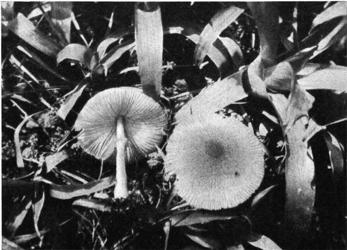
Abb.1. Lepiota lutea (WITHERING) GODFRIN

Fleisch papierdünn, weißlich, rasch welkend.