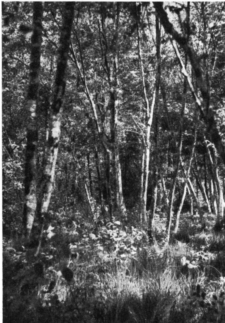
Abb. 2. Die Weißerlen im südlichen Sumpfwald Unterwuchs: Frangula , Molinia , Dryopteris , Carex brizoides usw.

dings nicht bezeichnet werden, überhaupt gehören charakteristische Schwarzerlenbrüche in der Schweiz zu den Seltenheiten. Wo diese nordische Waldgesellschaft früher unsere versumpften Talsohlen besiedelte, finden wir heute Wiesen und Äcker, im besten Falle noch Streuwiesen. Das Egelmoos ist auch zu klein und liegt zu inselhaft inmitten einer allzu konkurrenzfähigen Vegetation – von welcher seine eigene ständig verdrängt zu werden droht –, als daß sich eine solch ursprüngliche Pflanzengesellschaft hier noch vollständig aufzubauen vermöchte. Dazu kommt der Einfluß des Menschen, der durch Veränderung des Grundwasserspiegels, durch Holzschlag und künstliche Aufforstung eine Entwicklung nach rein natürlichen Gesetzen ausschließt.