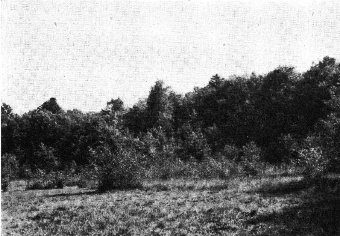
Abb. 3. Die Moorwiese. Blick gegen Süden

Der Fieberklee, Menyanthes trifoliata , schiebt seine hellgrünen, fleischigen Schosse weit ins Wasser vor. Im Frühling schmückt er die