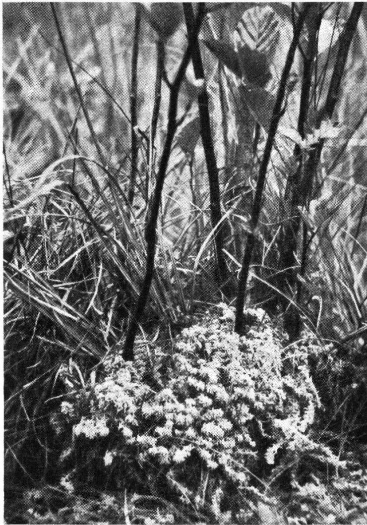
Abb. 4. Sphagnum subsecundum , polsterbildend an Stämmchen von Alnus incana

Alnus incana soll durch natürlichen Anflug hergekommen sein und entwickelt sich zu zahlreichen, aber kümmerlichen Sträuchern. Der Untergrund gestattet nur ein gehemmtes Wachstum, ein daumen-dicker Ast zählte 15 Jahrringe. Regelmäßig stehen die dürftigen Stämmchen ab, wenn sie eine gewisse Höhe (ca. 1,2 m) erreicht haben.