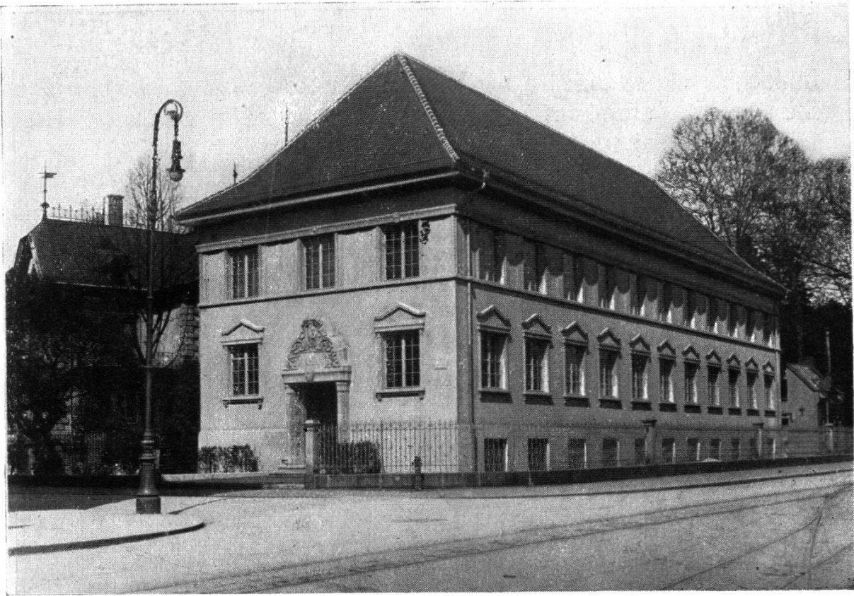
Das Museum vom Bahnhofplatz aus