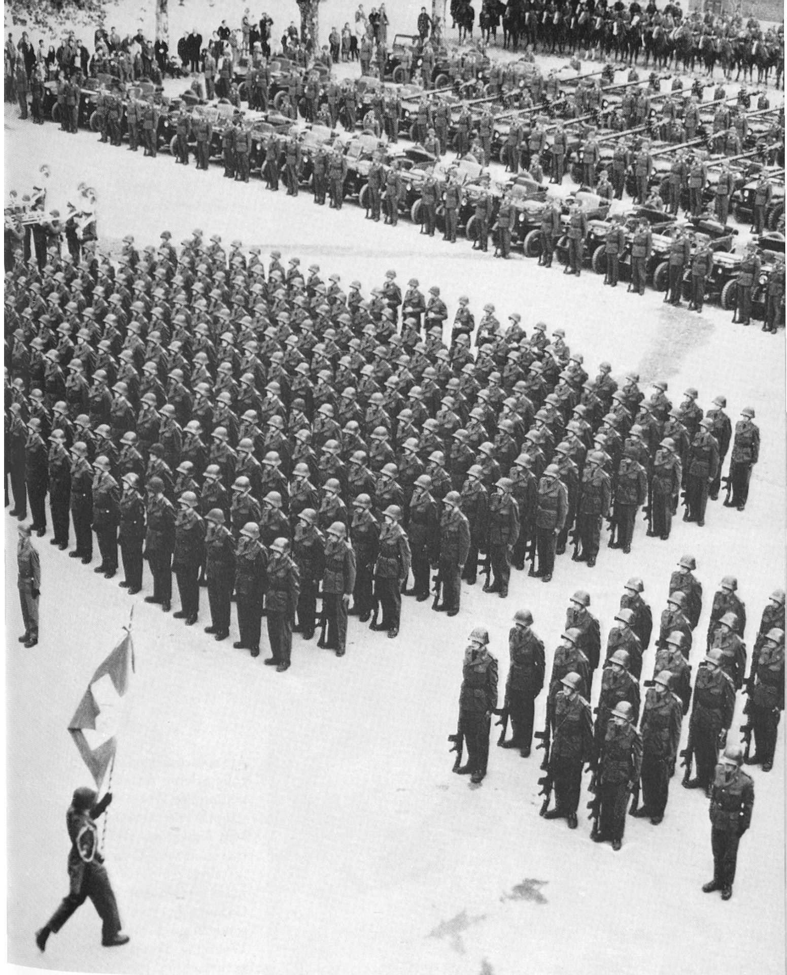
Im Hof der Aarauer Kaserne fand am 27. Mai 1963 die Fahnenabgabe der Inf. RS 5 und der Kav. RS 19 statt.