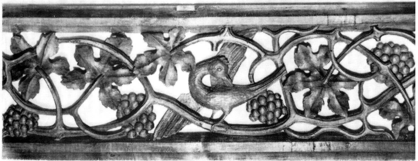
Täferschnitzereien aus den alten Aarauer Ratsstuben aus dem Jahre 1519